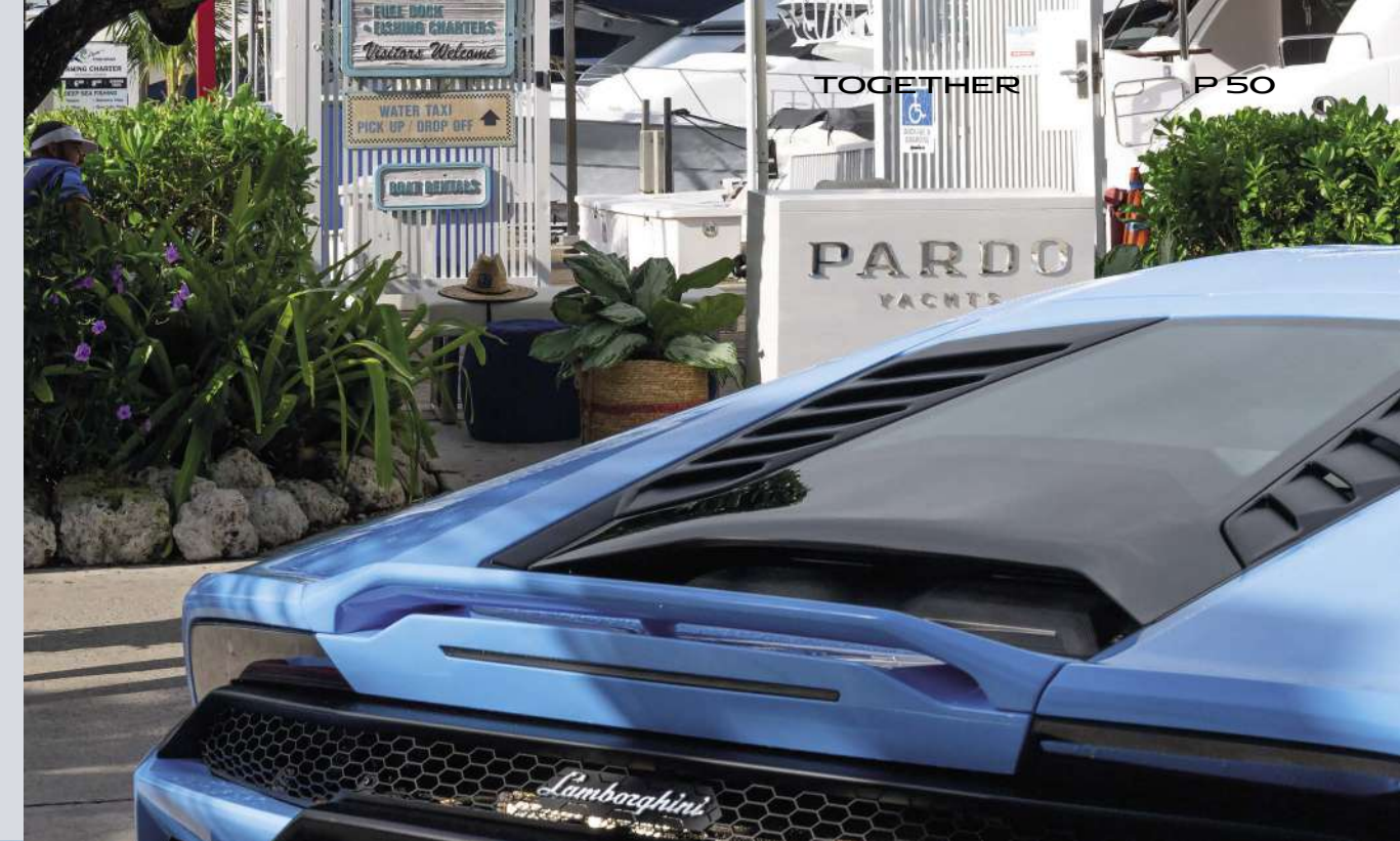
MIAMI - PARDO YACHTS & LAMBORGHINI