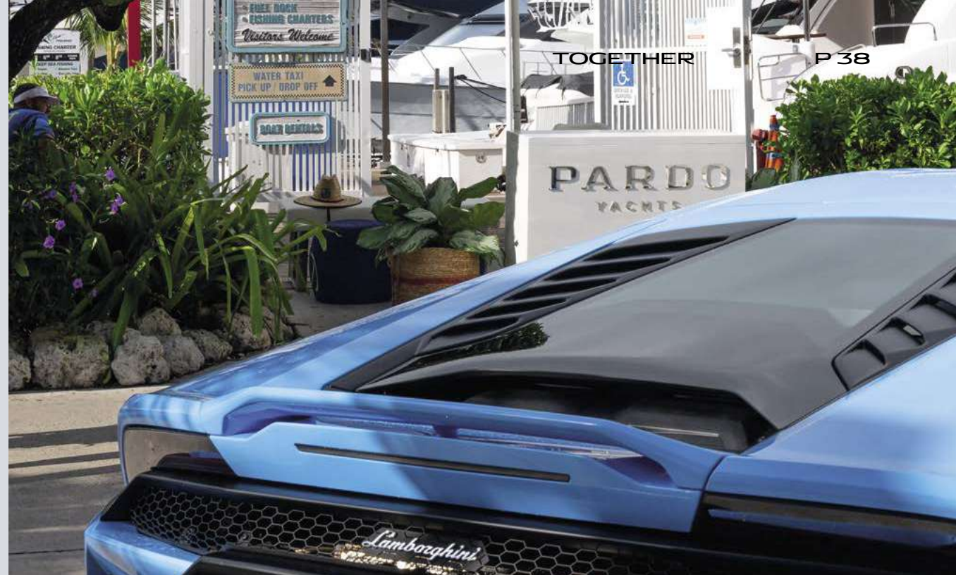
MIAMI - PARDO YACHTS & LAMBORGHINI